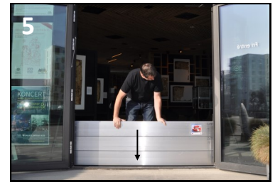
Bjælkerne presses sammen og ned mod gulvet, så bundforseglingen kan optage evt. ujævnheder