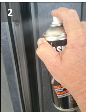
Smør grundprofilernes læbelister med silikone af god kvalitet før montering af bjælker