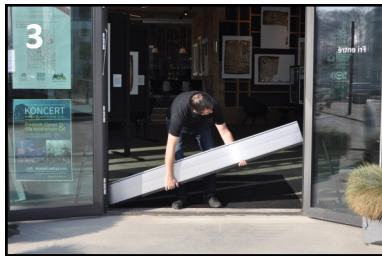
Nederste bjælke (m. bundforsegling) lægges først. NB. Bundforseglingen skal, når bjælken er monteret, sidde i bjælkenoten i hele bjælkens længde