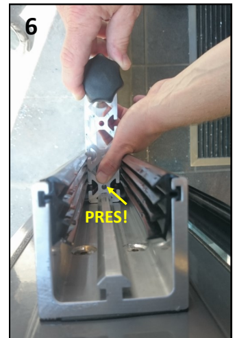
Spændestykker - spænd kun let!

Sæt spændestykkerne i - et i hvert profil. Sørg for at presse den ende af spændestykket, der hæftes på grundprofilet, ned mod bjælken, mens der spændes. Derved 'bider' spændestykket sig fast i profilet (billede 6).