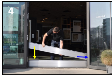
Bjælken presses ind i den ene side og ned i den anden. Hold (ved blå pil) 1-2 cm afstand til underlag eller underliggende bjælke.